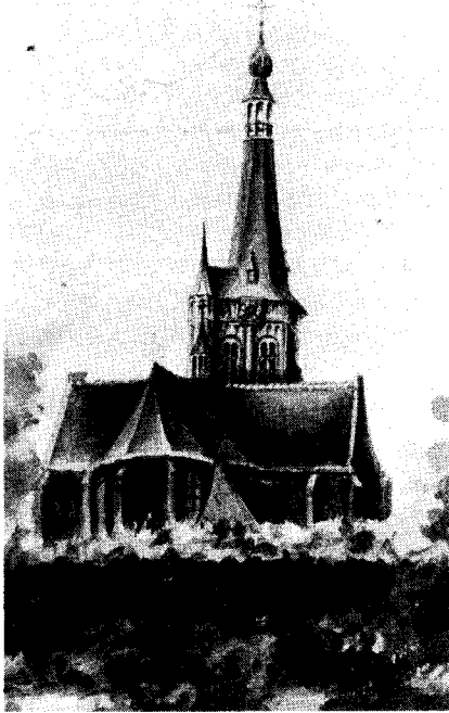
Achterzijde kerk 't Heike eind 18e eeuw