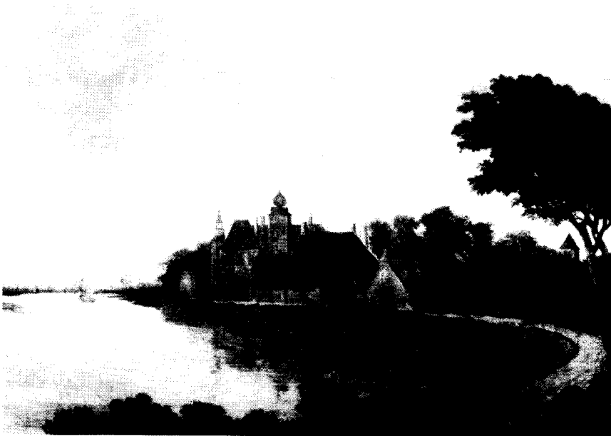
Het klooster te Berne aan de Maas bij Heusden. Paneel uit de 17e eeuw