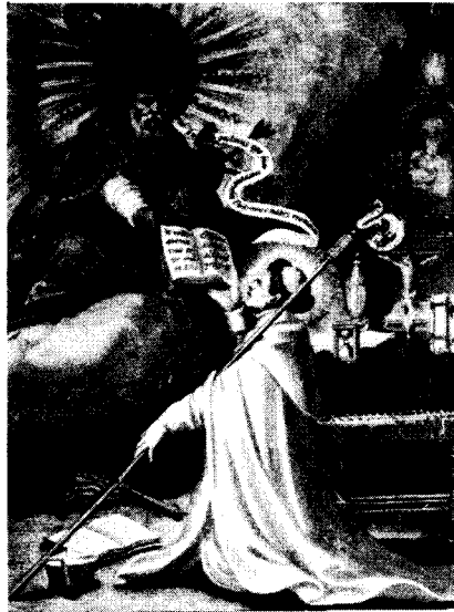
Norbertus ontvangt de Regel van de H. Augustinus

grondslag gelegd voor de meer specifieke gerichtheid op de zielzorg van de latere witheren, naast het onderhouden van het koorgebed, de persoonlijke armoede, en de claustrale levensstijl. Dit paste wonderwel in een periode dat steeds meer de behoefte ontstond om ordegeestelijken te betrekken bij de zielzorg, geheel in de lijn van de doorwerking van de resultaten van de Investituurstrijd, ook op het niveau van de lagere geestelijkheid. Tenslotte zou op het derde concilie van Lateranen (1179) het verbod worden afgekondigd, dat bezitters van eigen kerken op hun domeinen nog de zielzorgers zouden benoemen.