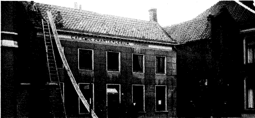
De herberg van Klaassen "De Zwarte Leeuw" (tijdens sloop in 1929).

de loop van de dag komen verschillende provinciale en gemeentelijke autoriteiten onder leiding van de Commissaris des Konings op het Tilburgse raadhuis bijeen, om zich te beraden over de situatie. De brigade marechaussee is inmiddels met zestien man versterkt. In de loop van de middag en avond komt vanuit Den Bosch een detachement van het 2e Regiment Infanterie bestaande uit 4 officieren en 100 manschappen in de stad aan.