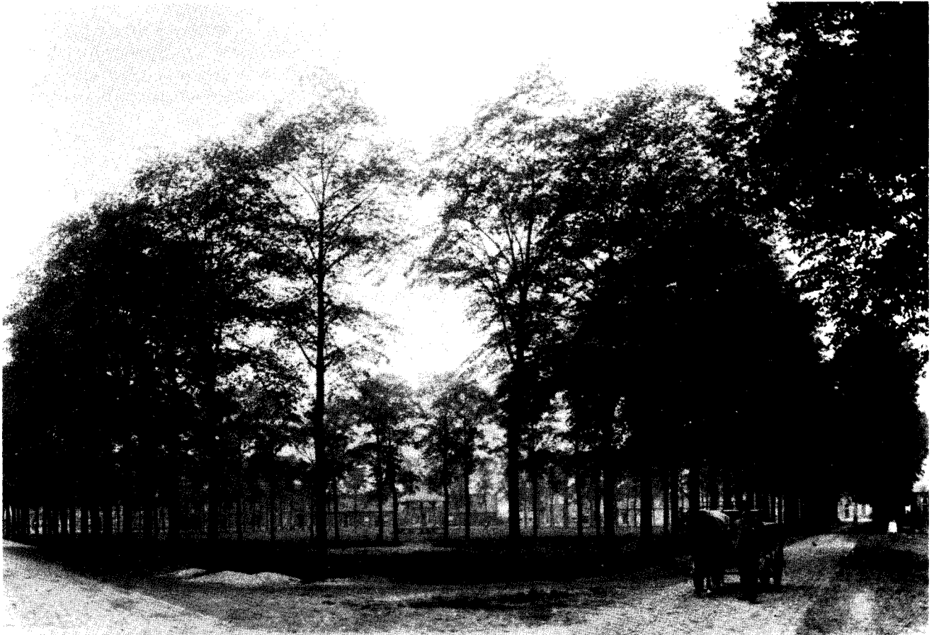
Een vroege foto van de Veldhoven (Wilhelminapark), gezien vanuit de tegenwoordige Veldhovenring, 1892.

rechtbank van 's-Hertogenbosch. De officier blijkt de zaak hoog op te nemen: