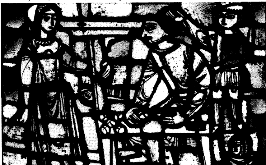
De ballenfruterij in de kunst, raam van glazener Cox uit Maasniel