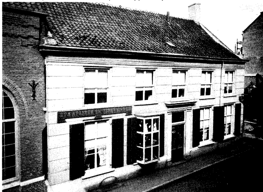
Piet Mercx begon in 1837 een winkeltje in staafijzer en ijzerwaren in de Nieuwlandstraat.

De productie van stoomketels is pas na ca. 1870 in Tilburg van de grond gekomen. Rond 1870 zijn vrijwel alle stoomketels in de Tilburgse fabrieken van buitenlandse, Belgische, makelij. 10) Blijkbaar was er voor de Tilburgse ijzerwerkplaatsen geen eer te behalen tegen de nabijgelegen, oudere, en al veel verder ontwikkelde Belgische machinenijverheid. Pas na 1870 worden in Tilburg ketelmakerijen opgericht, waarbij niet-Tilburgers de belangrijkste initiatiefnemers zijn.