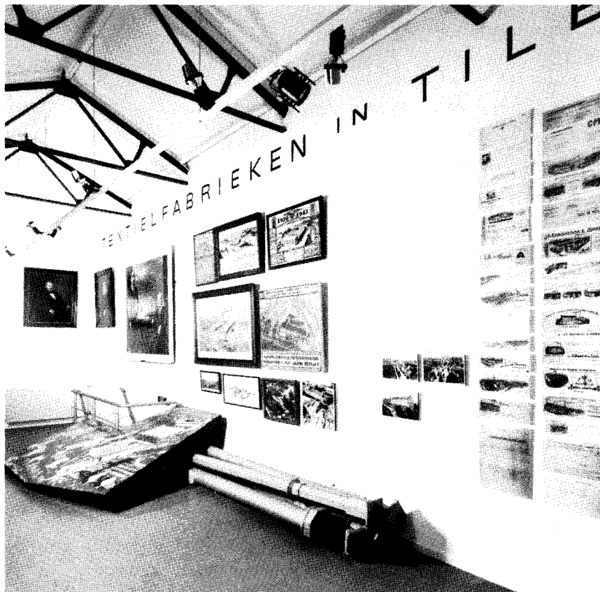
De tentoonstelling in de vide boven de entree-ruimte van het Nederlands Textielmuseum.

den Bergh, Brouwers, Diepen, Van Dooren, Enneking, Eras, Franken, Janssen(s), Mutsaerts, Mommers, Pessers, Van Spaendonck, Swagemakers en Verschuuren verbonden waren. Maar ook indirect, zoals voor hen die werkzaam waren in de bouw of de machine-industrie, of in vroegere tijden, de kaarden- en drijfriemenfabrieken.