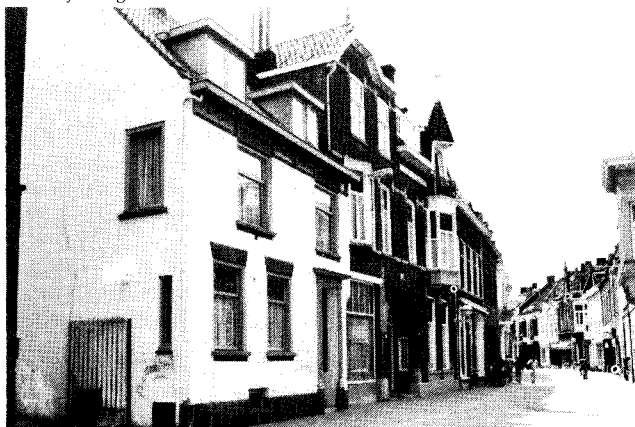
Nieuwlandstraat 6: de contouren van het 18e-eeuwse huis "De Olie-ton" zijn nog herkenbaar.