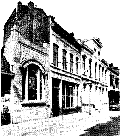
Contrasten: zuivere Jugendstil van architect J. van der Valk (nr. 41) vrijwel naast neo-classicisme van architect J. Wayers (nr. 35/37).

ker is dat de bewoning daardoor van karakter veranderde. Vanaf de 17e eeuw wordt het de eigenlijke dorpskern. Omstreeks 1660 zijn het noordelijk deel van de Markt, de Heuvelstraat (tot 1870 "Steenweg") en een gedeelte van de Nieuwlandstraat bestraat.