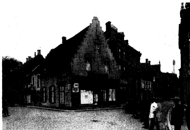
De "Oude Ster" met jaarakkers 1624 werd helaas gesloopt in 1914, om plaats te maken voor een "grootstedse" invulling die we echter nu weer waardevol achten als voorbeeld uit het oeuvre van een Tilburgse architect.