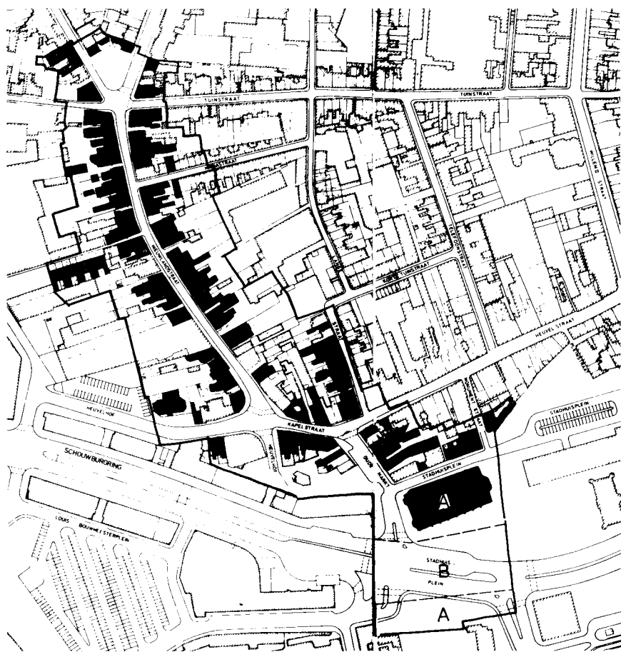
Stadsgezicht Oude Markt – Nieuwlandstraat: begrenzing, zones, en waardevolle bebouwing.

straat (nu: Bokhamerstraat, Boomstraat, Korte Schijfstraat). In veel Brabantse dorpen vinden we de kerk nog zo afzijdig van de hoofd-wegenstructuur, welke de oudere nederzettingen verbindt.