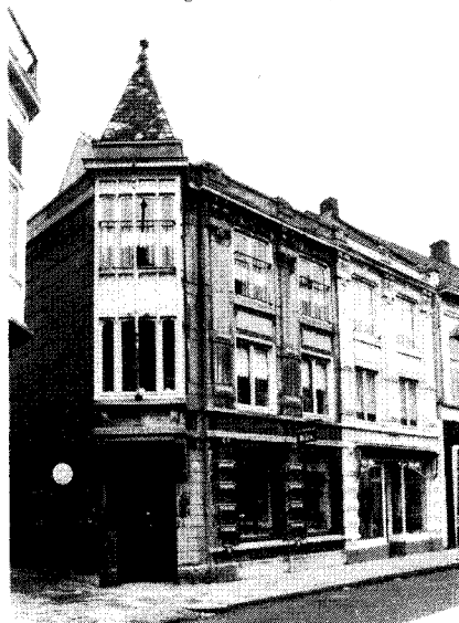
Achter deze gevels uit 1907 zit een 18e-eeuws houtskelet verborgen (nr. 23-25).

De neringdoenden komen nu tot welstand, waardoor in de loop van de 19e eeuw door "modernisering" het straatbeeld wordt beïnvloed. Vanaf het einde van de 18e eeuw en in de 19e eeuw maakt Tilburg en daarmee ook het beschreven gebied nog een andere ontwikkeling door. Er ontstaat in de vanouds bestaande wolnijverheid het moderne industriële en kapitalistische systeem. Naast de zich steeds moderniserende, maar toch nog altijd betrekkelijk kleinschalige bedrijven en de neringdoenden (tallose winkelpanden) ontstaan grootschalige industriële ondernemings- en handelsfirma's of financieringsinstellingen. Met name in de Nieuwlandstraat, maar ook aan de inmiddels ten dele gesloopte westzijde van de Markt is dat het geval. Zo verschijnen daar de monumentale kantoren en ondernemershuizen met op de achterterreinen fabriekspanden en magazijnen. Vooral de laatste staan in de Nieuwlandstraat vaak letterlijk haaks op de daarvoor nog bestaande percelering van agrarische oorsprong.