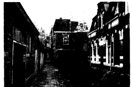
De Vincentiusstraat in de richting van de Nieuwlandstraat.

Uiteraard bood een zodanig ontwikkelde kern langs de hoofdstructuur nauwelijks ruimte voor arbeiderswoningen. Op het achterliggende terrein echter, op de nog lang agrarische gebruikte gronden, kon dit wel. Zo vinden we ter weerszijden van de Nieuwlandstraat zulke laat-negentiende-eeuwse door particuliere ondernemers op eigen grond aangelegde volkswijkjes: de Vincentiusstraat en de Mariastraat. Zij vertegenwoordigen een snel verdwijnend type dat echter gezien de tendens tot herbevolking van de binnenstad in beschermde en gerenoveerde staat een nieuwe functie kan hebben.