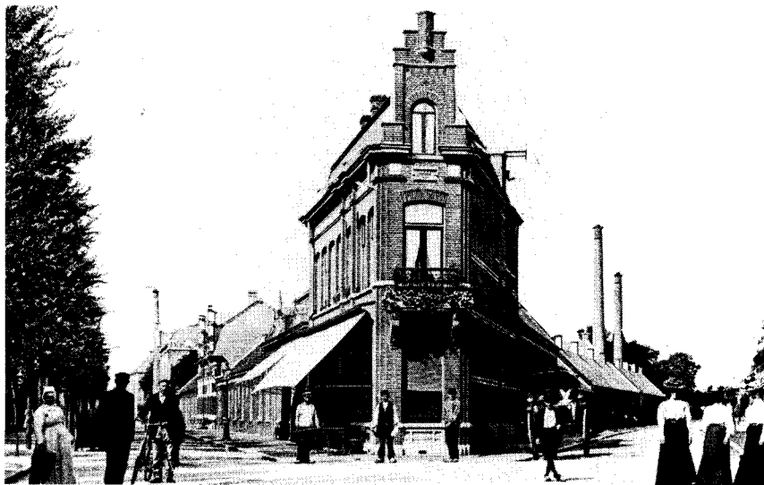
Splitsing Koestraat-Enschootsestraat ca. 1908.

Deze stad met haar perspectief. Deze stad met haar lange, lange straten. Dat was vooral zo in onze jeugd, toen zij nog niet lag in den roden ring van nieuwe wijken. Als ge moest lopen van den Hasselt tot