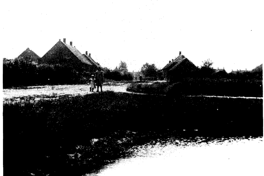
De brandkuil van de Heikant ca. 1904 (foto H. Berssenbrugge).

Neen, als men praat of vertelt over deze goede stad heeft men het niet over grote dingen: maar over kleine dingen, die goed zijn. Het jaar ging zijnen gang. De maandmarkten op den Heuvel markeerden den loop der maanden. Het was einde Augustus en de kermis werd opge-