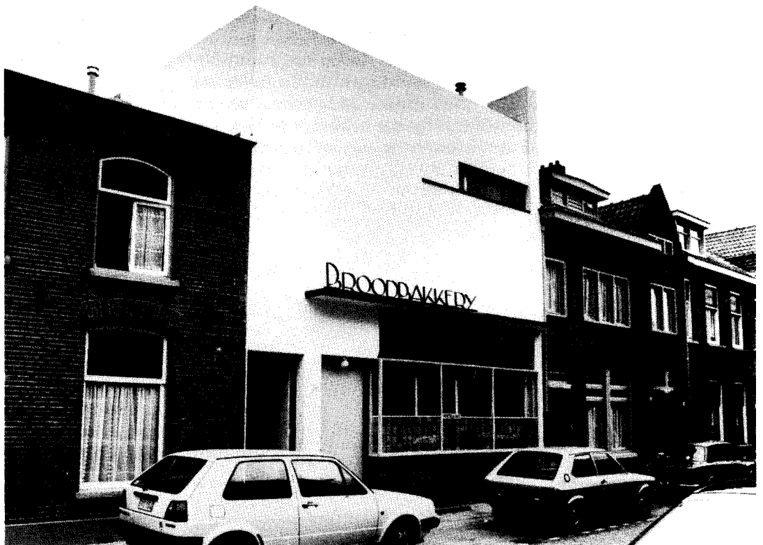
Afb. 1 Bakkerij Vorselaars, Acaciastraat 23, gebouwd in 1932 (foto 1985, Gemeentearchief Tilburg).