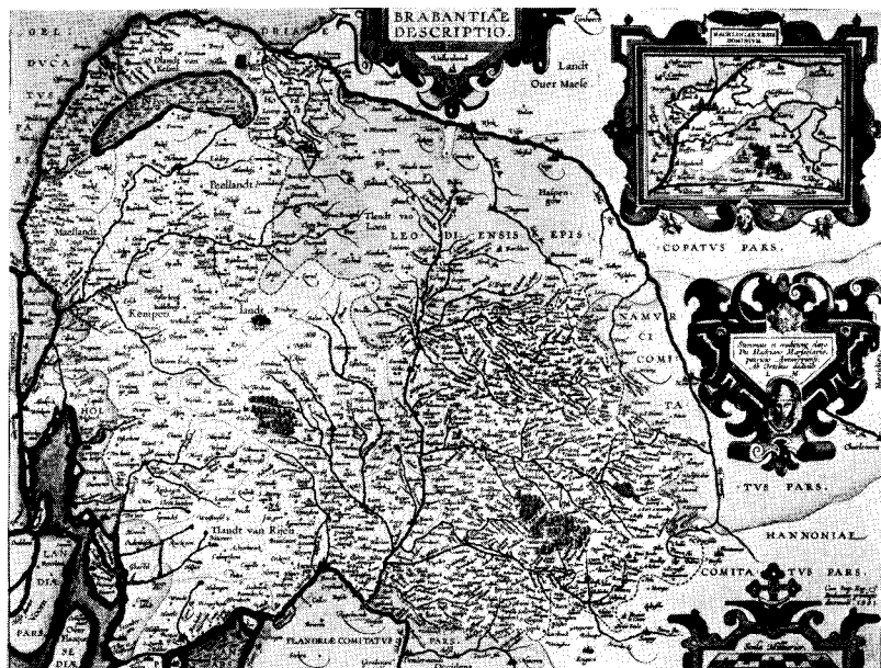
Afb. 1 Kaart uit 1591 van het voormalige hertogdom Brabant, met Mechelen rechtsboven in cartouche en Tilburg en Den Bosch middenlinks. Uitgave van Ortelius 1606 (coll. Gemeentearchief Tilburg).

De gemeyntheit, dat wil zeggen de gemeenschappelijke gronden die door iedereen gebruikt werden om vooral schapen te laten grazen, was overal. De akkers van Pauwels en zijn tijdgenoten lager ermiddenin en waren op een primitieve manier afgescheiden met lage zandwallen. Dit diende om de wind en loslopend vee tegen te houden. Pauwels moest erg zuinig zijn op zijn zaaigoed. Elk zaadje leverde slechts 3 à 4 nieuwe zaadjes op, dat wil zeggen ongeveer 4 à 5 mud per ha. Een gemiddelde hoeve besloeg zo'n zestien ha, waarvan steeds een groot gedeelte braak lag. Reken dan maar uit: ongeveer vijftig mud opbrengst per jaar, voornamelijk rogge, rogge die gebruikt werd voor het dagelijkse brood, voor de pap en voor de belasting. Daarnaast werd er ook nog haver, gerst en hop verbouwd. De haver was voor het vee en