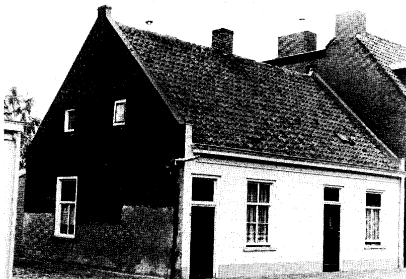
Afb. 7 In 1875 werden de huizen Hasseltstraat 241-239 als één grote weverswoning gebouwd. Hier groeide Frans van Hest op.