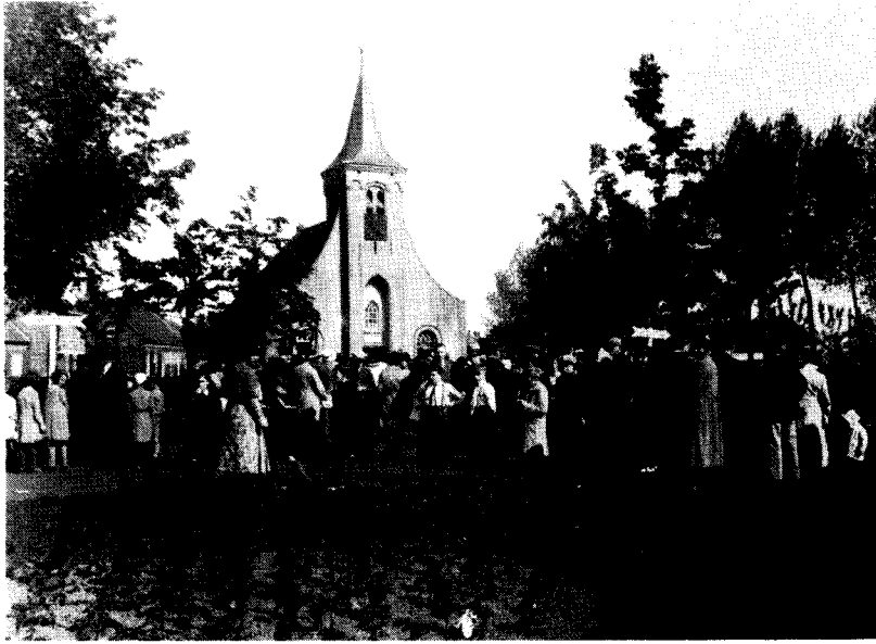
Afb. 2 De Hasseltse kapel op een zondag in mei, 1930.

de grote cultuurhistorische waarde onderkennen. In 1967 kon door particuliere actie de Tongerlose hoeve gered worden, in 1970 werd de boerderij "de Oliemeulen" op de rijksmonumentenlijst geplaatst en werd de ernstig vervallen Hasseltse kapel door restauratie behouden. In 1971-'72 leek het laatste uur geslagen voor de arbeiders- en weverswoningen aan de Reitse Hoevenstraat en voor de huizen in de Bokhamer. De gemeenteraad besloot tot afbraak, het gebied werd betrokken bij het bestemmingsplan "'t Zand" en kreeg de bestemming onderwijs (scholenbouw). Dankzij de niet aflatende inzet van een groep particulieren, waaronder leden van de heemkundekring "Tilborch" en de werkgroep Leefbaarheid, werden de plannen via bezwaarschriftenprocedures bij Gedeputeerde Staten teruggefloten. Terzelfder tijd werden 27 objecten op de rijksmonumentenlijst geplaatst.