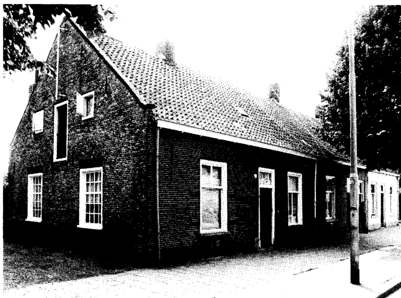
Afb. 2 Zij- en voorgevel Reitse Hoevenstraat 60 (foto Dré van den Bogaard, 1976).

In deze gevel bevinden zich de achterdeur, het venster van de opkamer, het grote venster van de weefkamer, het kleine venster van de "geut" en de ventilatieopening van de kelder. Opvallend is het kleine venster naast de deur, dat voorzien is van een draaiend raampje met kruisroede. Het bovenlicht van de achterdeur heeft in tegenstelling tot dat van de voordeur een normale roede-ver-