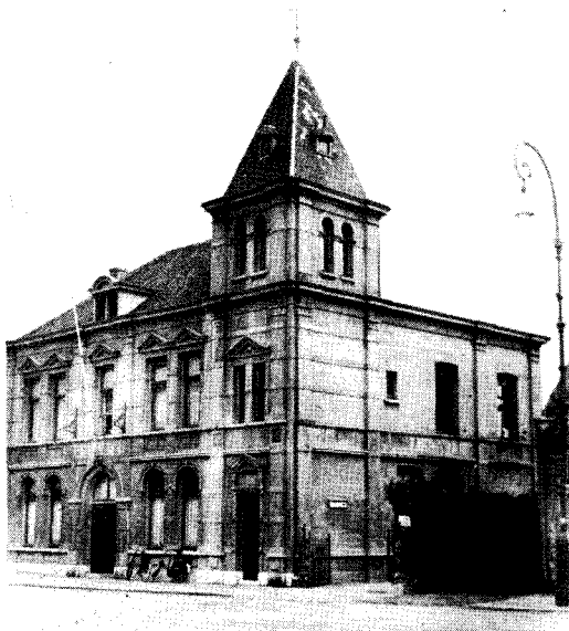
Afb. 1 Het oude hoofdbureau van Politie in de Bisschop Zwijzenstraat. Op de eerste verdieping was sinds 1909 de Technische Dienst gehuisvest. Foto 1940.