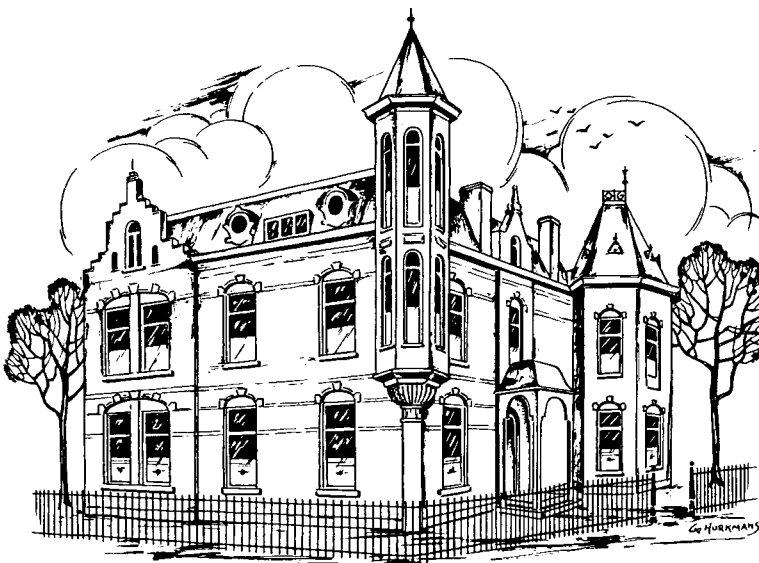
afb. 3 Het voormalige woonhuis 'Villa Cecilia' van de familie Kessels.